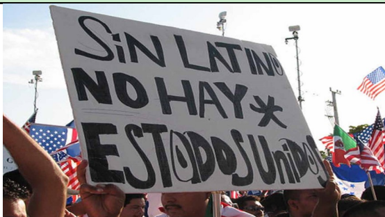
Los latinos en Estados Unidos ya representan uno de cada cinco habitantes

Como pastores, los obispos de los Estados Unidos, estamos unidos a nuestro pueblo en nuestro Señor Jesucristo, por lazos de comunión y compasión. Nos inquieta ver en nuestras comunidades un clima de temor y ansiedad ante las prácticas de perfilamiento (análisis automatizado de datos personales) y la aplicación de las leyes migratorias. Nos entristece profundamente el tono que ha adoptado el debate contemporáneo y la creciente denigración de los inmigrantes.