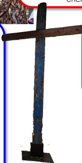
Cruz de Lampedusa. realizada con la madera de una de las barcasas que naufragó el 3 de octubre de 2013

"¿Quién de nosotros ha llorado por este hecho y por hechos como éste?". ¿Quién ha llorado por la muerte de estos hermanos y hermanas? ¿Quién ha llorado por esas personas que iban en la barca? ¿Por las madres jóvenes que llevaban a sus hijos? ¿Por estos hombres que deseaban algo para mantener a sus propias familias? Somos una sociedad que ha olvidado la experiencia de llorar, de "sufrir con"; ¡la globalización de la indiferencia nos ha quitado la capacidad de llorar!